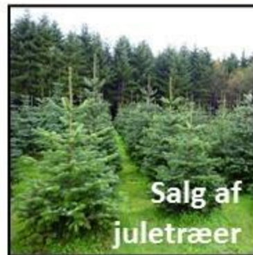
Salg af juletræer

25., 26. & 27 nov. 2022 Ågerupvej 34, Ågerup, 4000 Roskilde