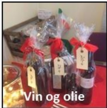
Vin og olie